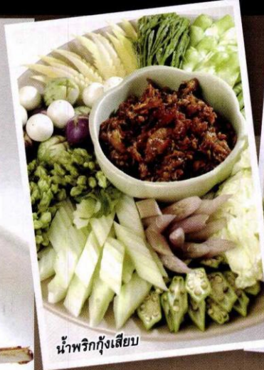
น้ำพริกกุ้งเสียบ