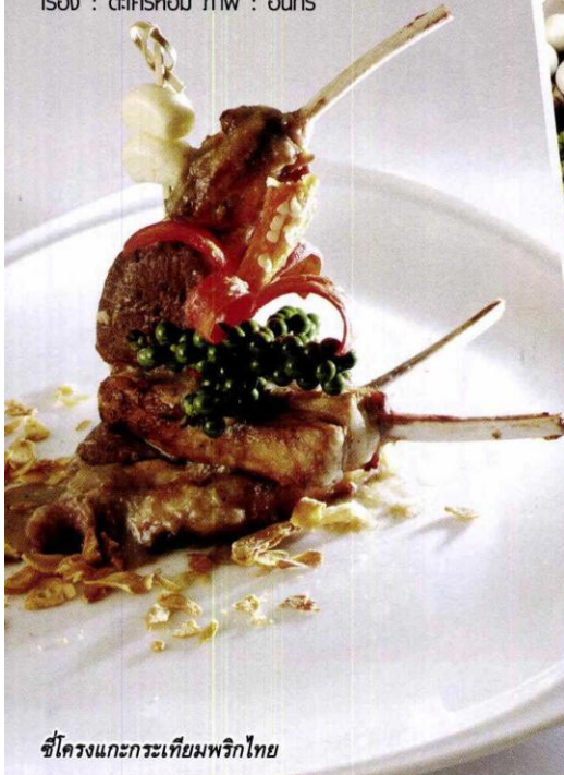
ซีโครงแกะกระเทียมพริกไทย