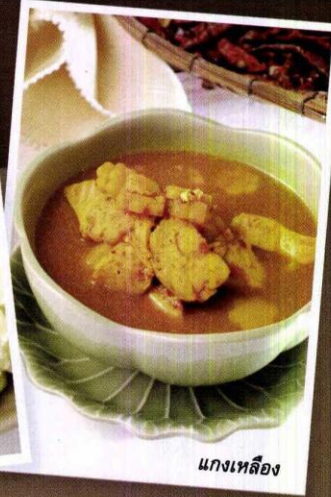
แกงเหลือง

เที่ยววีบีเป็นเรื่องที่ค่อนข้างสะดวกหากมีอาชีพพิเศษของคุณ เลือกที่จะอร่อยกับอาหารระดับโรงแรม ยิ่งถ้าเป็นโรงแรมที่เป็นที่รู้จักด้วยแล้ว เรียกว่าถ้าเดินเข้าไปในโรงแรมก็จะมีห้องอาหารที่มีอาหารหลายสไตล์ให้คุณได้เลือก ทั้ง ไทย จีน ญี่ปุ่น ยุโรป ฯลฯ เช่นเดียวกับที่โรงแรมสยามซิตี บนถนนศรีอยุธยา ซึ่งหนึ่งในห้องอาหารของที่นี่ 'ตะครีบทอม' ขอแนะนำห้องอาหารไทย Spice & Rice Thai-Halal Restaurant